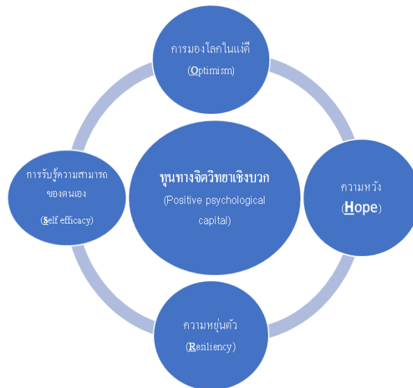
ภาพ 1 ทุนทางจิตวิทยาเชิงบวก (positive psychological capital) ตามแนวคิดของลูธานส์ (Luthans et al., 2007)

8. มีความสัมพันธ์ต่อพฤติกรรมกาปฏิบัติงาน เช่น การศึกษาของลูธานส์ (Luthans, 2002) ที่ศึกษาพฤติกรรมองค์กร (organizational behavior: OB) พบว่าทุนทางจิตวิทยาเชิงบวกส่งผลต่อพฤติกรรมกาปฏิบัติงานในองค์กรแบบ 4 ด้านหรือที่เรียกว่า “SHOR” ดังภาพ 1