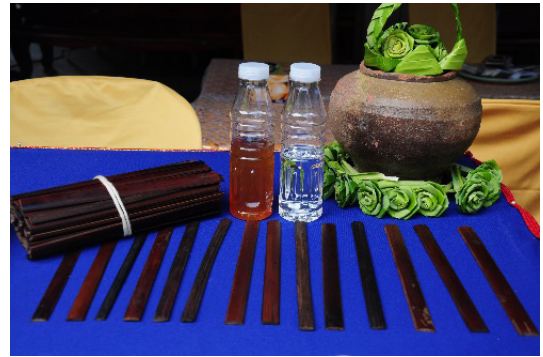
ภาพที่ 3 สูตรน้ำมันสมุนไพร