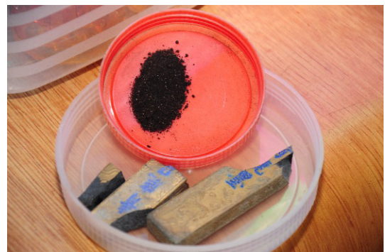
ภาพที่ 4 ยาสมุนไพรรักษาโรคหรือปรวด

สมุนไพรรักษา ประกอบด้วย หนังกว ครอบงูเห่า หัวหนอนตายอยาก ลูกลำโพง ต้นทองพันชั่ง เจตมูลเพลิง หัวกรงเขมา พริกไทย แก่นฝาง แก่นแห้ว (ต้นสแรว) กระเทียม หมึกดำ (หมึกจีนเป็นแห่ง) หัวหมากหมก ต้นโคกกระสุน ต้นคदनกูด (เพ็ร์นใบมะขาม)