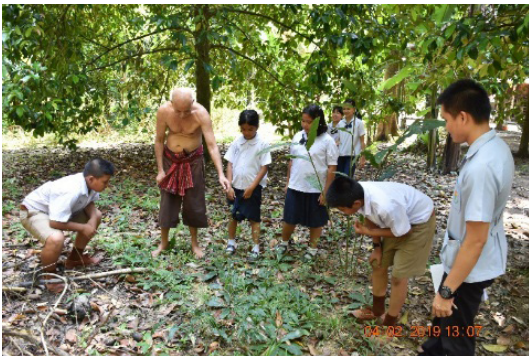
ภาพที่ 6 สอนนักเรียนรู้จักพืชสมุนไพรรอบบ้าน

คลังความรู้สำคัญด้านสุขภาพของชาว อสม. (อาสาสมัครสาธารณสุขประจำหมู่บ้าน) ซึ่งนอกจาก อสม. จำนวนมากได้เรียนรู้เรื่องสมุนไพรอย่างลึกซึ้งเพื่อนำไปใช้ประโยชน์และเผยแพร่ความรู้แก่ชุมชน แล้วหลายท่านยังมาอาสาเป็นผู้ช่วยหมอพื้นบ้านในการจัดเตรียมยาและผลิตยาสมุนไพร รวมทั้งช่วยบริการด้านส่งเสริมสุขภาพแก่ผู้ป่วยที่มาใช้บริการในศูนย์เรียนรู้ของพ่อหมอเสริมด้วย เช่น การคัดกรองเบาหวาน ความดันโลหิต การคัดกรองสุขภาพจิต เป็นต้น