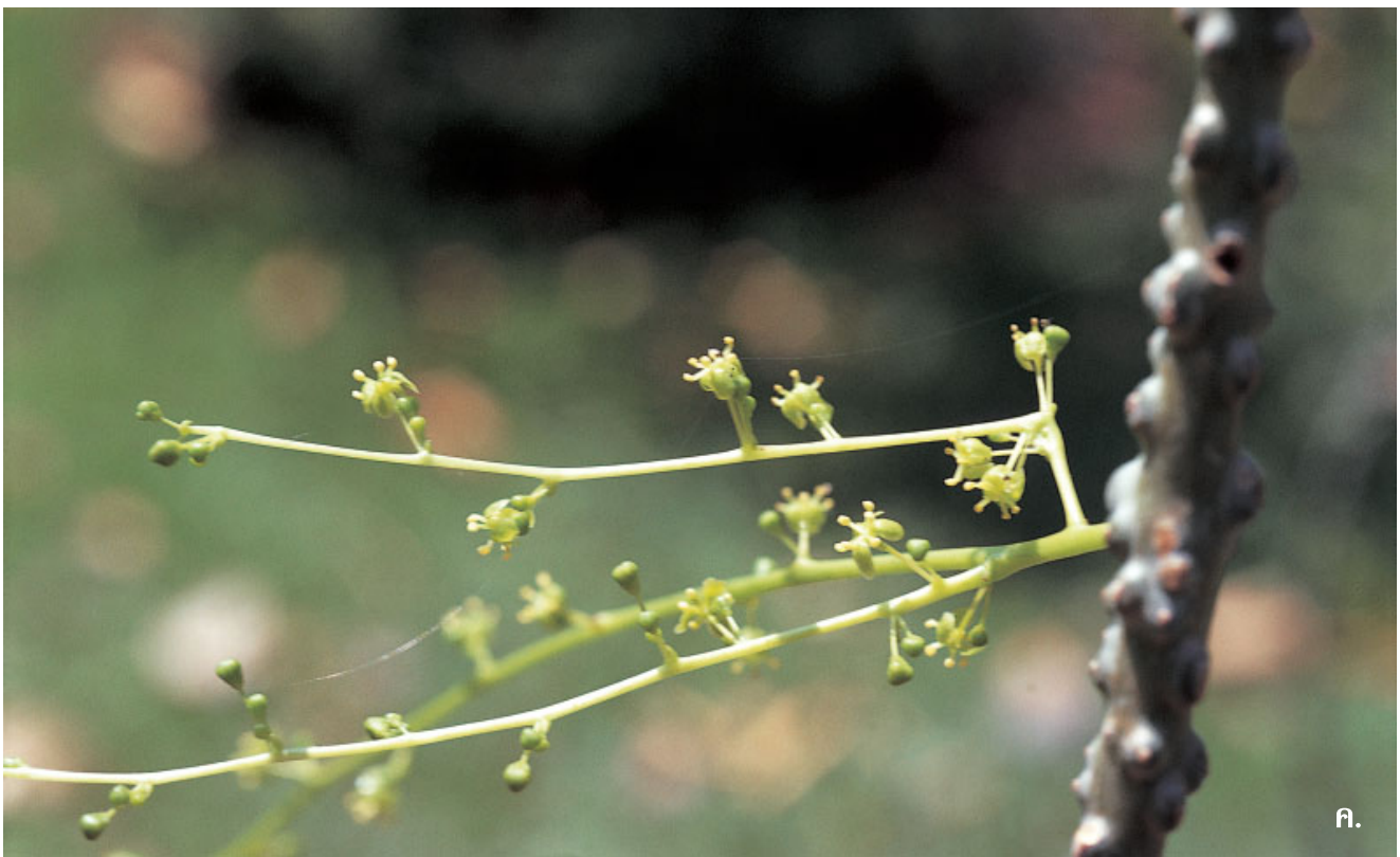
บอระเพ็ด ( Tinospora crispa (L.) Hook.f.&Thomson)