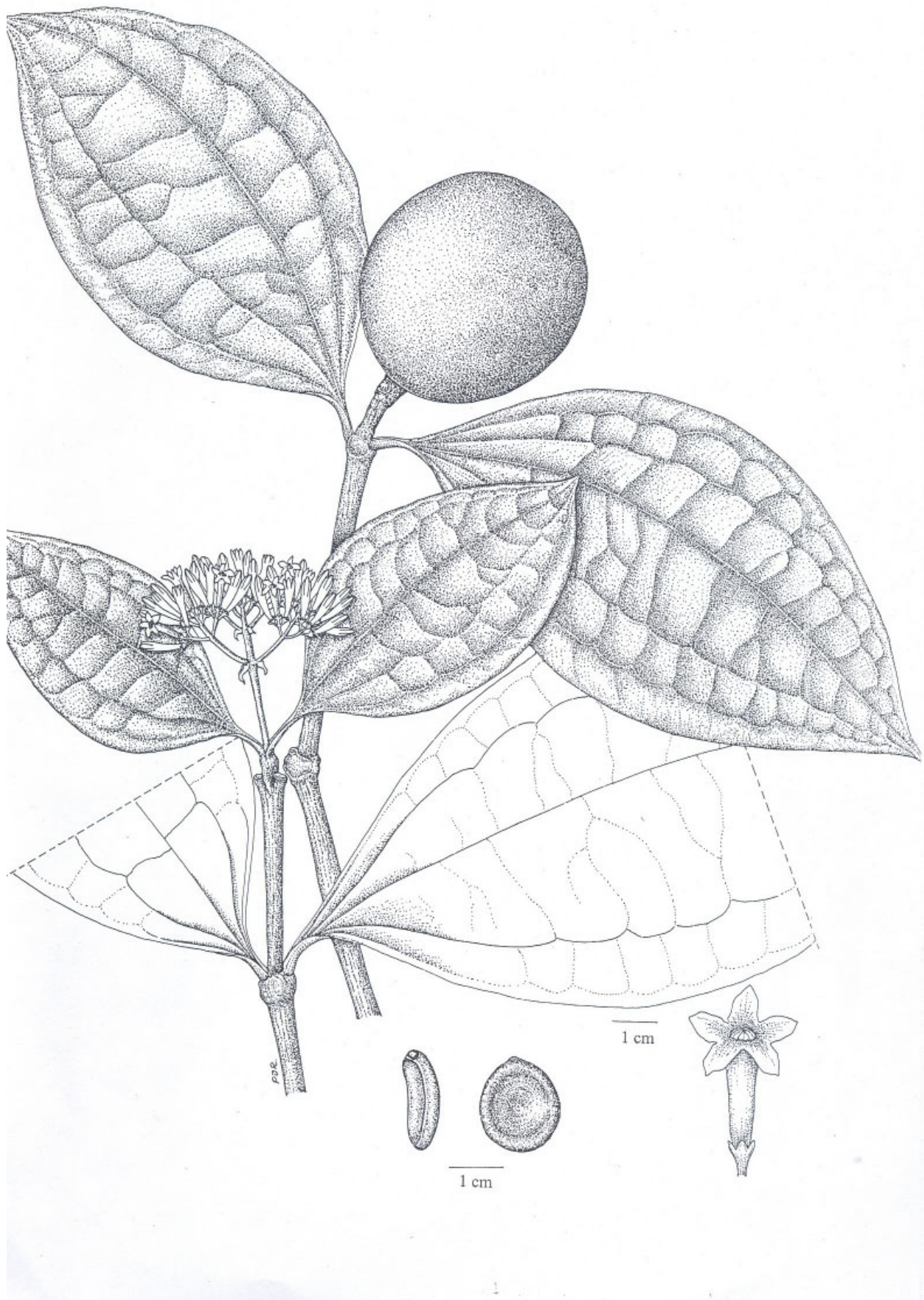
ภาพลายเส้นแสดงใบ, ช่อดอก, ดอก และเมล็ดของโกฐกะลิ่ง