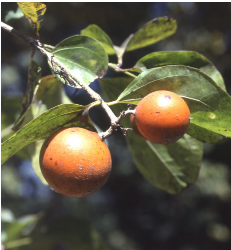
ต้นแสลงใจ แสดงใบและผล