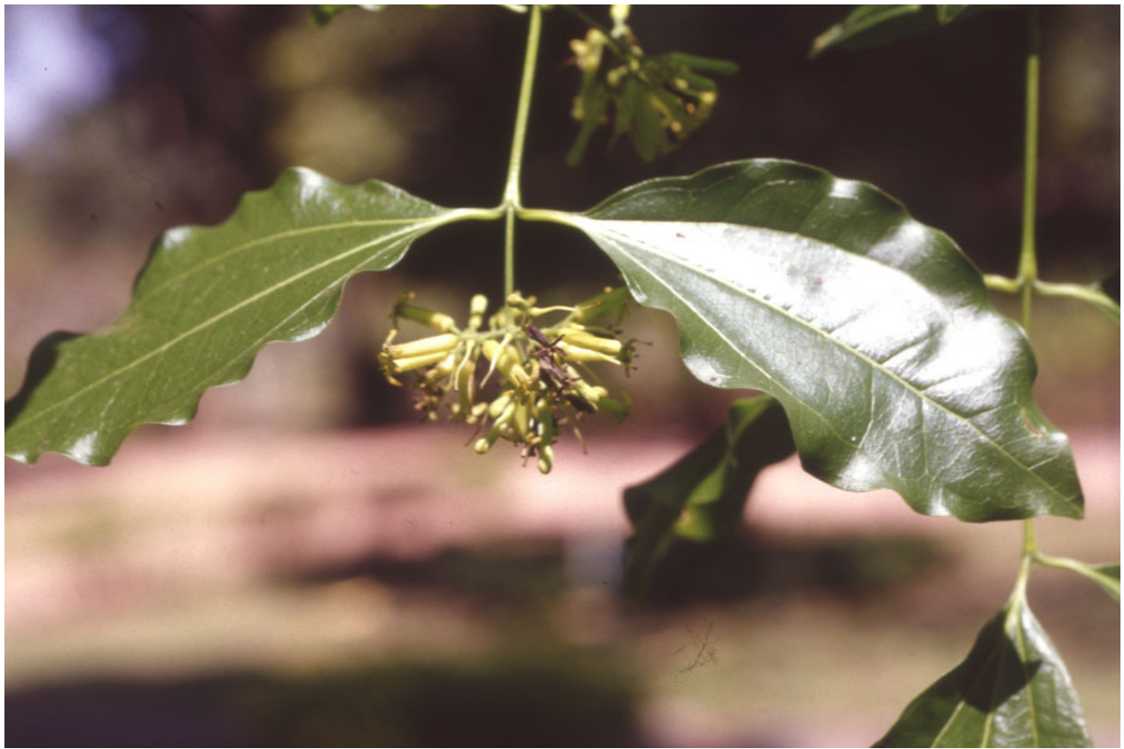
ต้นแสลงใจแสดง กิ่ง ใบและช่อดอก