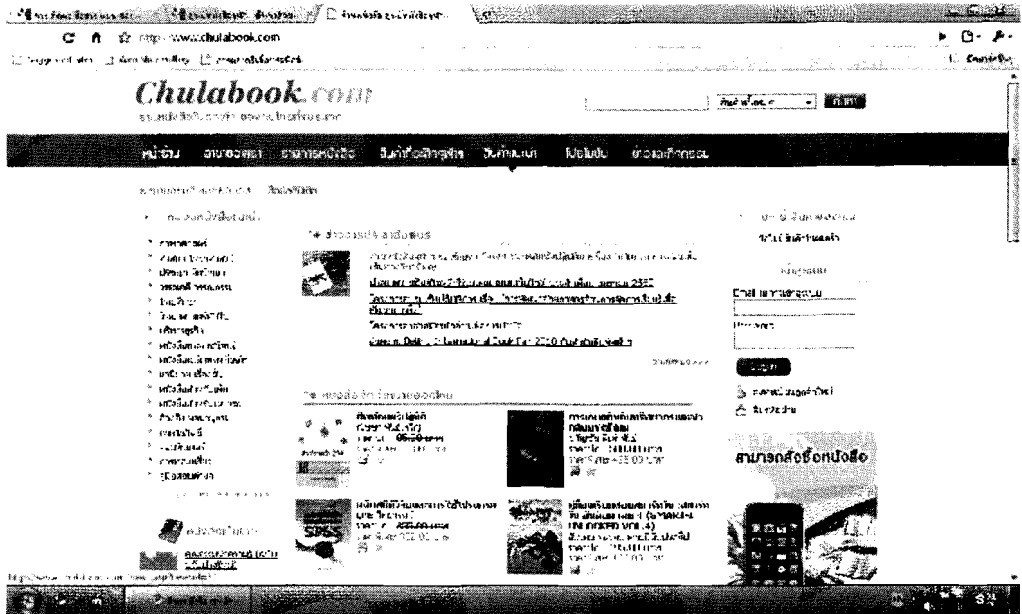
ตัวอย่าง การซื้อขายสินค้าผ่านอินเทอร์เน็ต