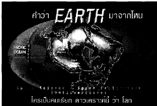
ตัวอย่าง Banner

1. การโฆษณาผ่านทางป้ายโฆษณา (Banner advertising) เป็นป้ายโฆษณาที่แสดงผ่านสื่ออินเทอร์เน็ต โดยภายในมีรูปภาพ ข้อความที่แสดงรายละเอียดของสินค้าหรือบริการของผู้จัดทำ เพื่อเป็นการประชาสัมพันธ์ ให้ผู้ใช้อินเทอร์เน็ตได้รับทราบ โดยป้ายโฆษณาจะเป็นวัตถุขนาดเล็กส่วนใหญ่เป็นรูปสี่เหลี่ยมผืนผ้าหรือสี่เหลี่ยมจัตุรัสที่มีขนาดแตกต่างกัน แสดงอยู่บนหน้าเว็บไซต์