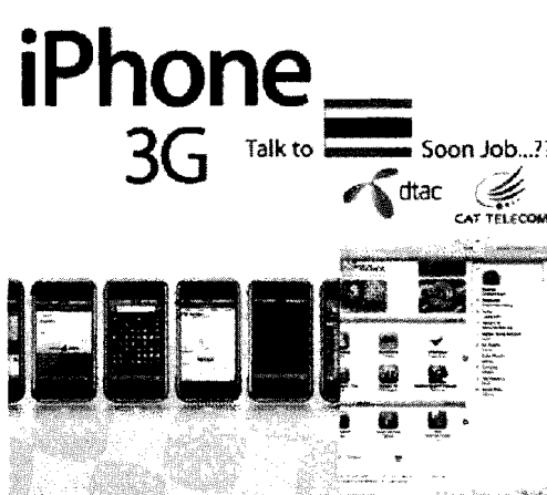
ตัวอย่าง Rich media

ความน่าสนใจให้กับป้ายโฆษณาเพิ่มขึ้น โดยมีการนำเอาสื่อ Multimedia อื่น ๆ มาผสมผสานเข้ากับป้ายโฆษณาแบบปกติด้วย