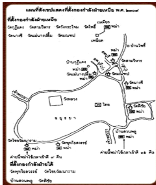
แผนที่สังเขปแสดงบริเวณที่ตั้งของกองทัพฝ่ายเหนือของพม่า ในสงครามคราวเสียกรุงครั้งที่ ๒ ราวปี พ.ศ.๒๓๐๓

ทางใต้ มีมังฆานรทาเป็นแม่ทัพ ยกทัพตีเมืองทวาย มะริด ตะนาวศรี และมุ่งหน้าขึ้นไปสมทบกับเนเมียวสีหบดีที่กรุงศรีอยุธยา