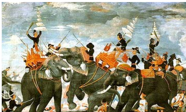
ที่มา : จิตรกรรมโดยสมเด็จพระเจ้าบรมวงศ์เธอ เจ้าฟ้าจิตรเจริญ กรมพระยานริศรานุวัดติวงศ์ แสดงภาพสมเด็จพระสุริโยทัย (กลาง) บนหลังช้างทรง ชับช้างเข้าระหว่าสมเด็จพระมหาจักรพรรดิ (ขวา) และพระเจ้าแปร (ซ้าย)