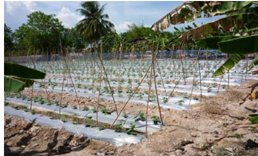
ภาพที่ 2 และภาพที่ 3 การสัมภาษณ์เกษตรกรที่เข้าร่วมโครงการและพื้นที่ทำการเกษตร